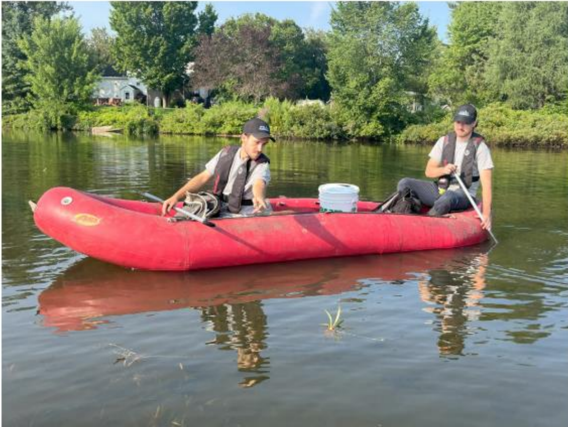
Une équipe de la CBJC effectuant un inventaire de PEE en milieu hydrique en zodiac.