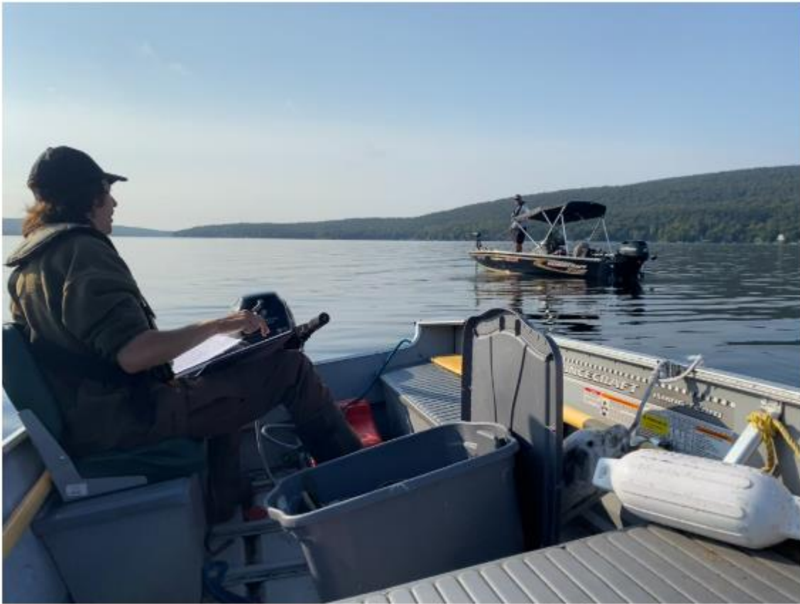
Notre chargé de projet recueillant des informations sur le touladi auprès d'un pêcheur.